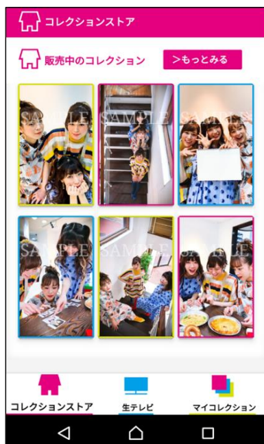
① デジタルフォトや楽曲を購入