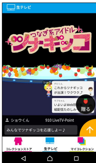
② Web限定番組視聴中にギフトイング