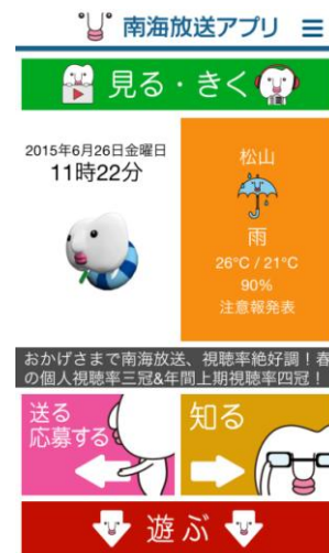
(南海放送アプリから閲覧)