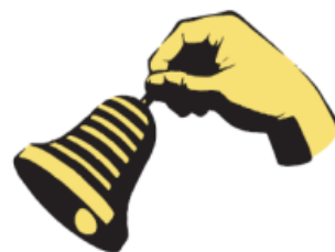
（ウェブベルマーク ロゴ）

報道関係者の皆様におかれましてもウェブベルマーク運動の促進に向け、何とぞ御理解、御協力を賜りますようお願い申し上げます。