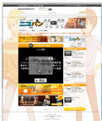
ニコニコ動画 番組公式ページイメージ