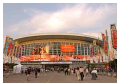
< 開催日の上海体育館 >

団長 北の湖 敏満 日程 北京：6月5日より2日間 上海：6月9日より2日間 会場 北京：首都体育館（収容13,000人） 上海：上海体育館（収容10,000人） 相撲団 総勢109名 競技 トーナメント方式 内容 日中国交正常化翌年の1973年以来31年ぶりに、日中航空協定30周年を記念して開催された。