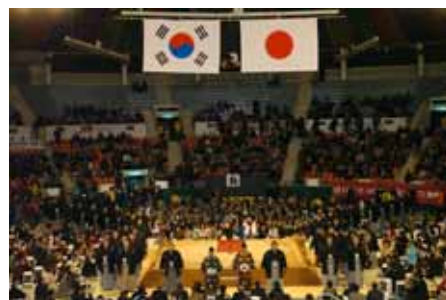
< 公演初日全員挨拶 >

団長 北の湖 敏満 日程 ソウル：2月14日より2日間 釜山：2月18日 会場 ソウル：槇忠体育館（収容8,000人） 釜山：サジク体育館（収容8,000人） 相撲団 総勢108名 競技 トーナメント方式 内容 日韓両国間の文化、スポーツ交流の促進を目的とした、日韓共同未来プロジェクトの一環として開催された。